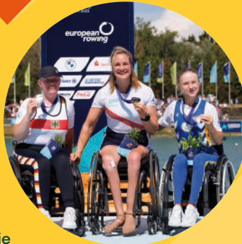
Siegerehrung Para Rudern bei den European Championships