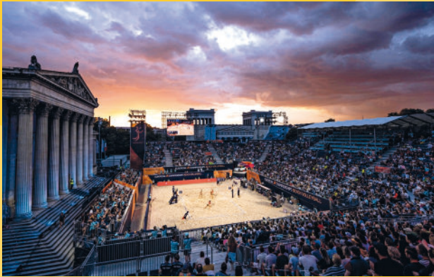
Abendstimmung bei den European Championships am Königsplatz

Sportgroßereignisse sorgen für einzigartige emotionale Erlebnisse in der ganzen Stadt. Das haben zuletzt die European Championships 2022 eindrucksvoll gezeigt. Der Sport überwindet Barrieren und steht für gemeinsame Werte.